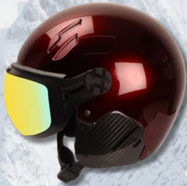
MAJOR ROUGE PROFOND - CARBONE