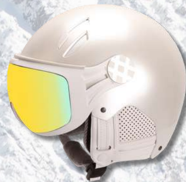
MAJOR NACRE - CUIR