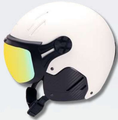
MAJOR BLANC GLACIER - CARBONE