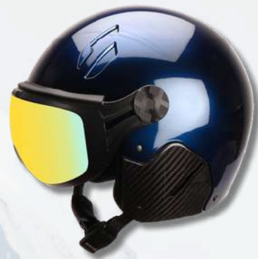
MAJOR BLEU PROFOND - CARBONE