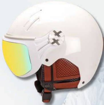
MAJOR BLANC - CUIR