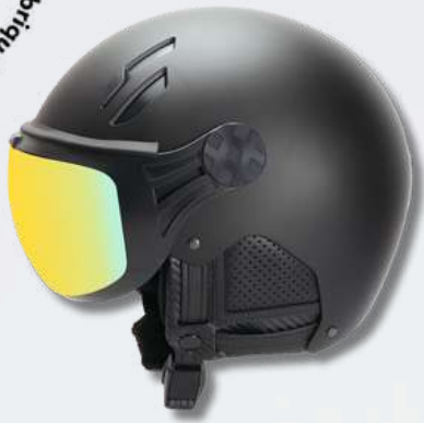
MAJOR NOIR - CUIR