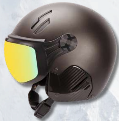
MAJOR GRAPHITE - CARBONE