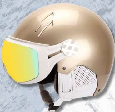
MAJOR CHAMPAGNE - CUIR